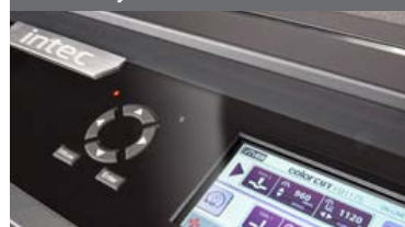
5" barevný ovládací dotykový panel.